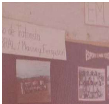
Curso de Tratorista