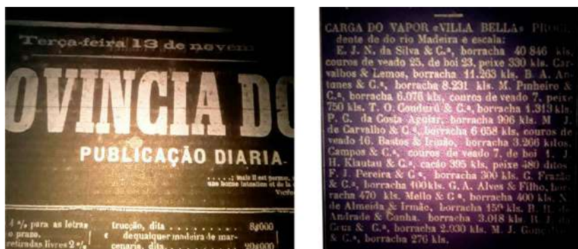
Fonte 1 - Jornal “A Província do Pará” novembro de 1877 - Biblioteca Pública Artur Vianna – Centur – Setor de Microfilmagem.