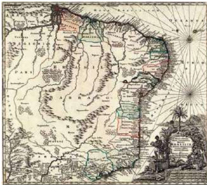
Figura 1 - Mapa do Nordeste brasileiro no século XVIII