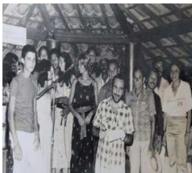
Encontro de idosos (a) - MOBRAL. Festival de Música (MOBRAL)