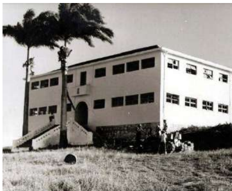
Figura 4 - Seminário Menor “Immaculada Conceição” de Nazareth