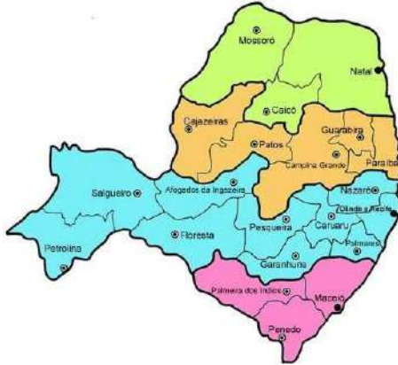
Figura 2 - Mapa da CNBB Nordeste 2

Pernambuco: Garanhuns, Nazareth e Pesqueira (1918); Petrolina (1923); Caruaru (1948); Afogados da Ingazeira (1956); Palmares (1962); Floresta (1964) e Salgueiro (2010), conforme Figura 2.