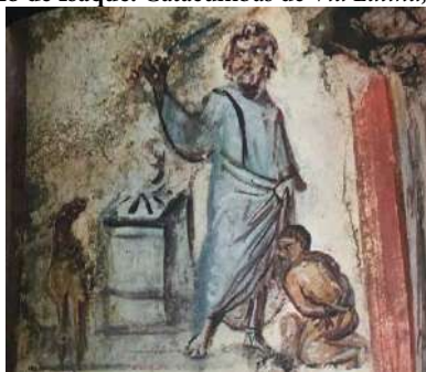
Figura 01 – O sacrifício de Isaque. Catacumbas de Via Latina , Roma, séc. IV (tardio).

Abraão (com traços faciais mais maduros) e Isaque (ajoelhado). Ao lado do Patriarca há um altar, e acima dele uma área da parede deteriorada. No canto esquerdo da imagem há um cordeiro, representando a vítima substituta. Afresco. Dimensões da imagem: