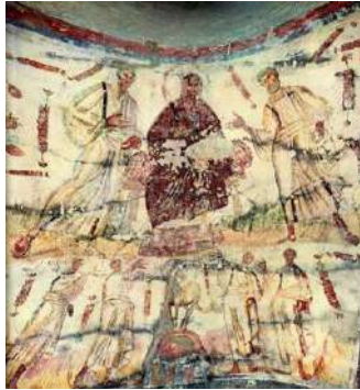
Figura 03 – Cristo entre mártires. Catacumbas de São Marcelino e Pedro, Roma, séc. IV (tardio).

A imagem divide-se em um plano superior, no qual há Jesus no centro e os apóstolos Pedro e Paulo, e um outro inferior, onde vemos os quatro mártires na presença do cor-deiro santo, representado com uma auréola. Afresco. Dimensões da imagem: 2.20 x 2.40.