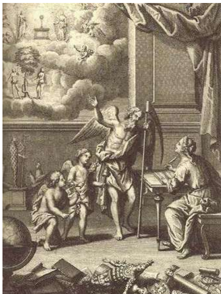
Figura 1: “A escrita e o tempo” [In LAFITAU, Joseph-François. Moeurs des sauvages américains comparées aux mœurs des premiers temps (1724). Reprodução a partir de: CERTEAU, Michel de. El lugar del otro . Trad. Victor Goldstein. Buenos Aires: Katz, 2007, p. 101.]

vols.), do missionário jesuíta Joseph-François Lafitau. Na imagem se defrontam uma representação da escrita e do tempo. “Uma pessoa em atitude de escrever” está em frente ao tempo. “Ela segura a pena que cria o texto; o outro, a gadanha que destrói os seres.”