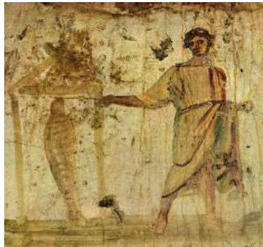
Figura 02 – A ressurreição de Lázaro. Catacumbas de São Marcelino e Pedro, Roma, séc. III (tardio).

Jesus está vestido com uma túnica, tem cabelos curtos, e segura uma varinha em direção à figura humana, a qual tem o corpo todo envolto em panos e sai de um sepulcro. Há uma diferença em relação ao tamanho de Jesus e o resto da cena, representada com menores dimensões. Afresco. Dimensões da imagem: 0,80 x 1.1 m.